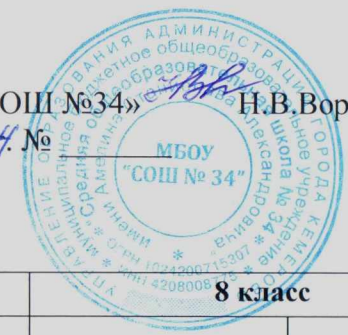
График Всероссийских проверочных работ в 2024 году